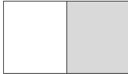
1/1 Site U 3 Umschlagseite B 210 mm x H 297 mm hinten innen